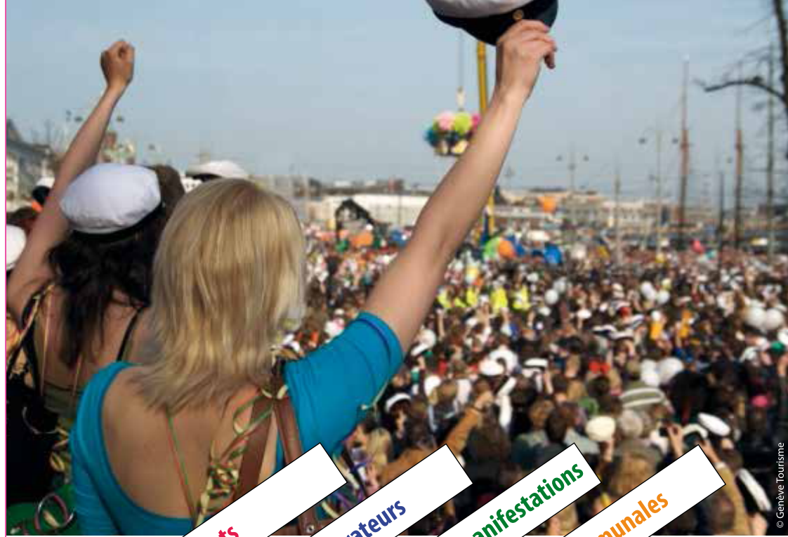
Août 2014 - 1000 ex.